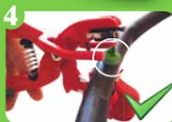
4 Colocación sin esfuerzos y sin escape de agua

Kliptx es una pinza innovadora que permite colocar fácilmente y eficazmente la mayoría de los goteros existentes en manguera de riego polietileno de diámetro 16 y 20 mm. Es inmediatamente operacional, no necesita ningún conocimiento o formación particular para su utilización, y gracias a su colocación "sin mirar", permite conectar rápidamente sus goteros sin escape de agua y sin esfuerzos, de manera duradera.