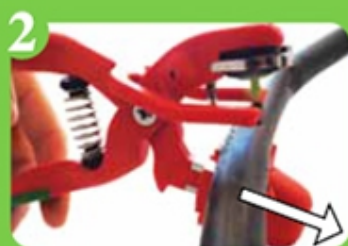
2 Realineación automática