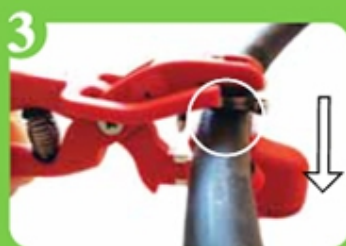
3 Inserción del gotero