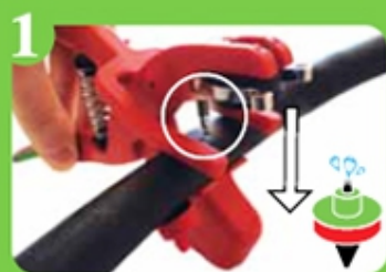
1 Perforación "sin mirar"

Pinza manual que permite la colocación de los goteros en manguera de riego polietileno 20-16mm